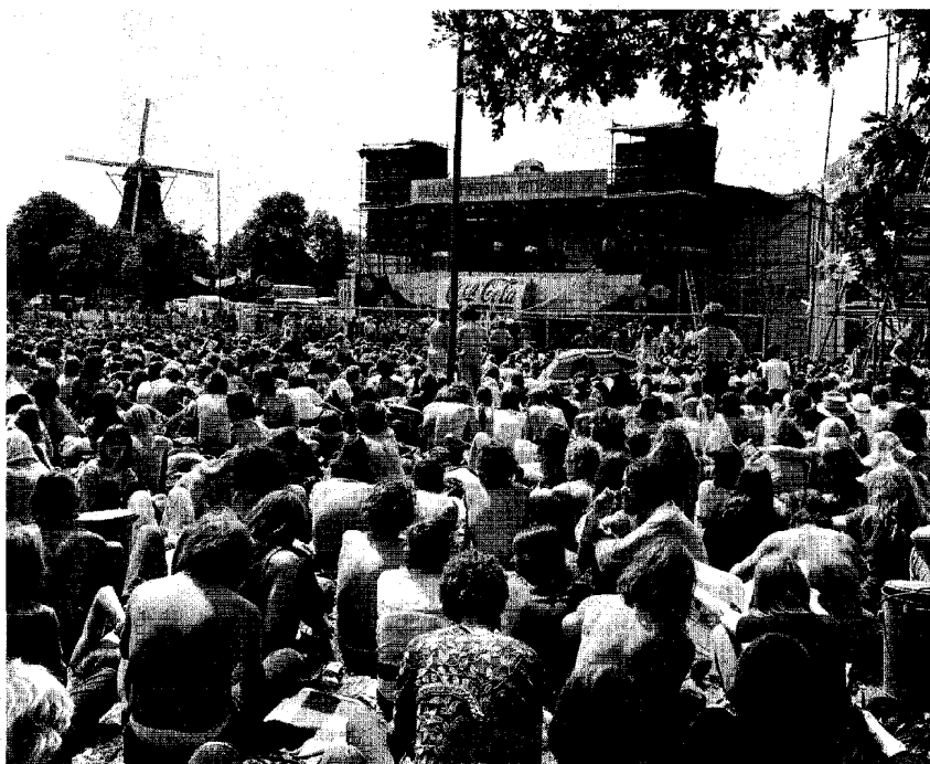
Het festivalterrein in het Kralingse Bos, juni 1970, vol slaapzakken. Het vreedzame love & peace-credo hing als een hasjwolk boven het terrein.