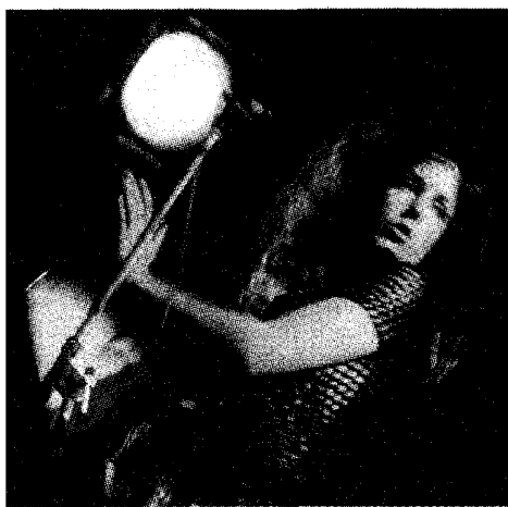
Grace Slick, zangeres van Jefferson Airplane, één van de optredende bands.